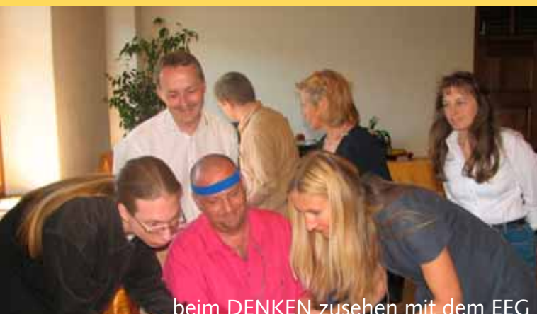
beim DENKEN zusehen mit dem EEG

Sie lernen die neuesten Tranceinduktionen von Richard Bandler aus DHE und NHR, vertiefen den Umgang mit dem Miltonmodell auch im Alltag z.B. im Verkauf!