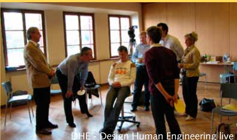
DHE - Design Human Engineering live

Weitere Informationen zu „trance port your id'eas“ finden Sie in der separaten Infobroschüre.